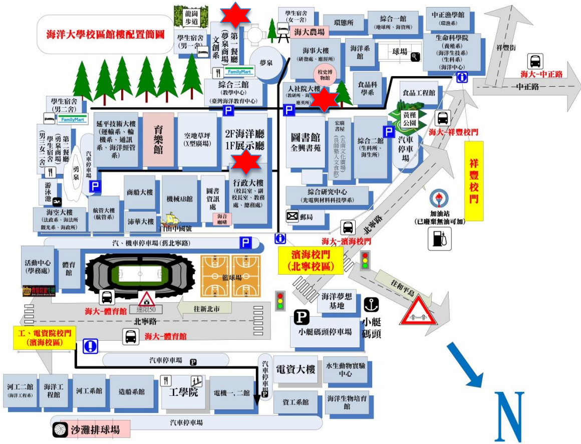
附圖一、國立臺灣海洋大學校區面圖。